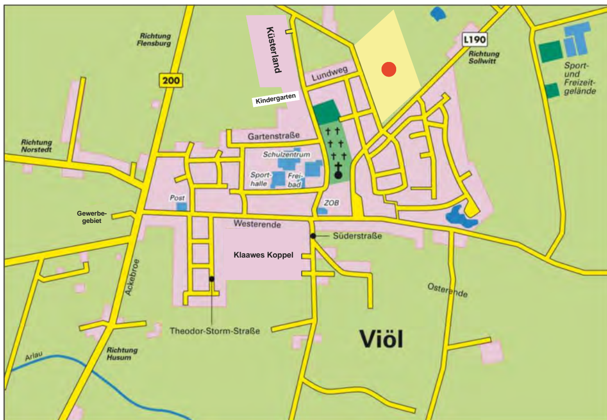
● Lage Baugebiet am „Sollwitzer Chaussee“ unverbindliche Illustration

Sie erreichen Viöl bequem über die Autobahn A 7, Abfahrt Schleswig-Schuby auf die Bundesstraße B 201, Kreisstraße 49 sowie über die Bundesstraße 200 Richtung Viöl.